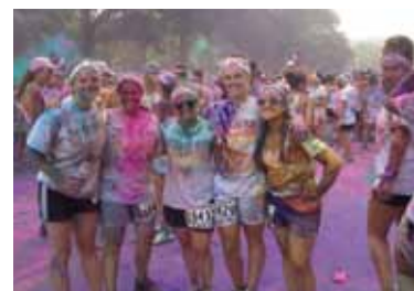
A sinistra la tappa bolognese nel 2013 della Run 5.30. A destra foto di gruppo all'arrivo della Color Run